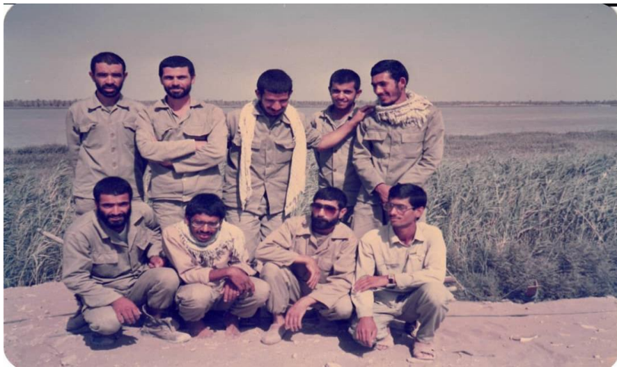
نشسته از راست: شهید حسن دانشمند