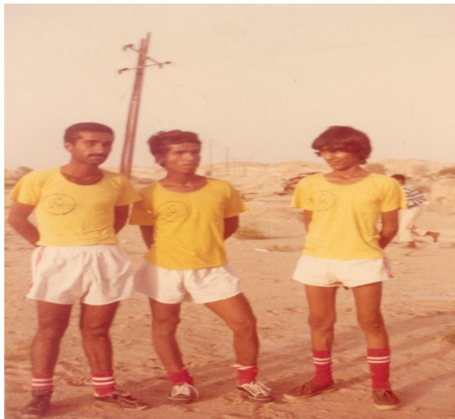
تيم نار ايسين سال 1359، نفر وسط شهيد عون آبسته