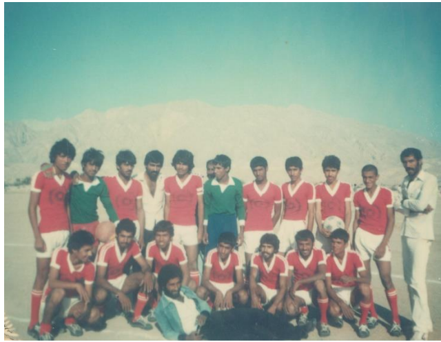
تيم نار ايسين ( زادگاه شهيد عون آبسته) سال 1359