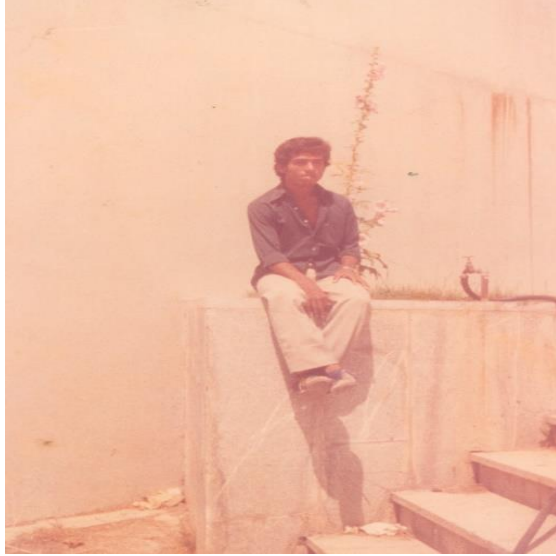
خانه ی پدری، ایسین